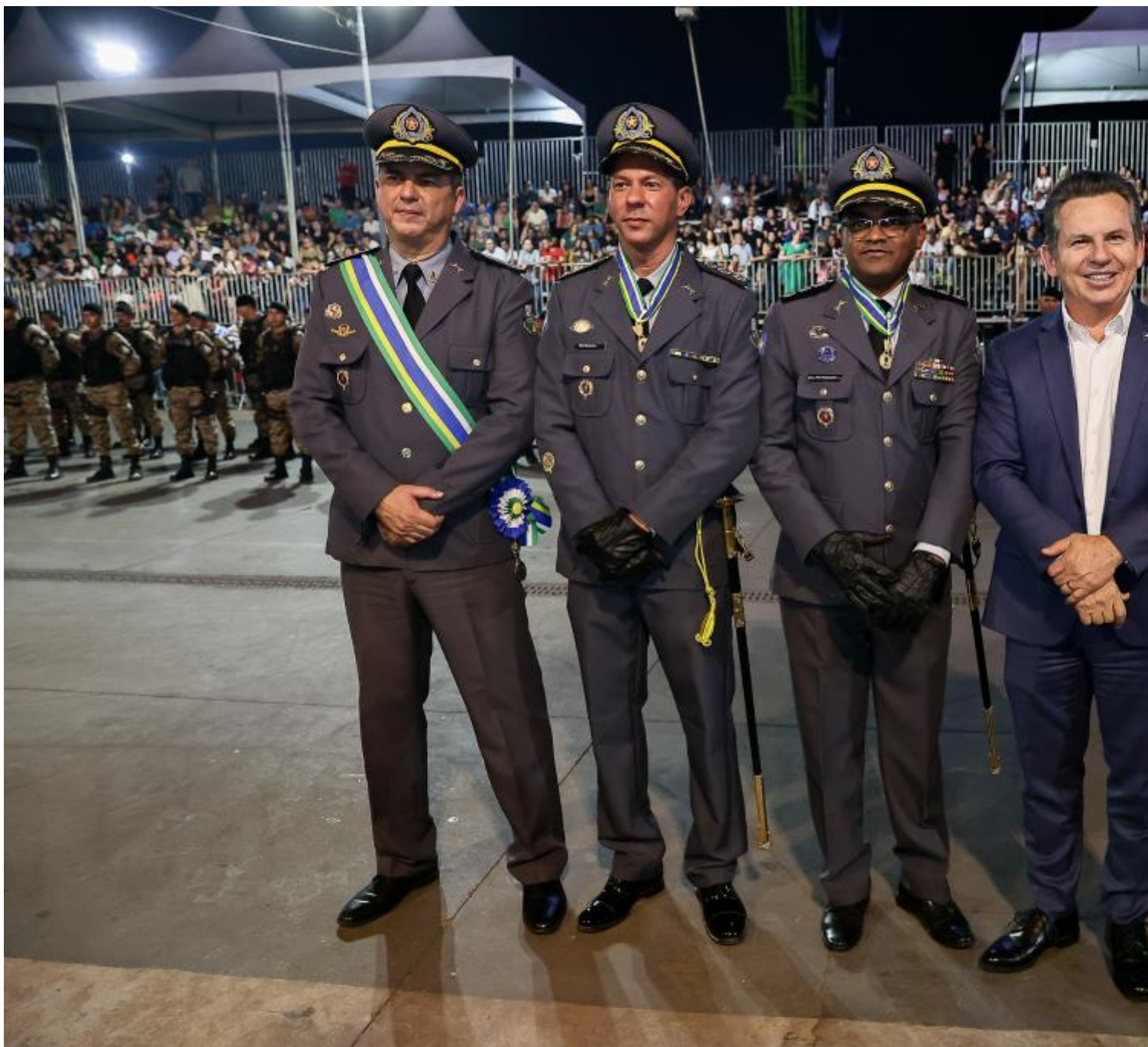
Governador Mauro Mendes ao lado dos novos coronéis

"Mais uma vez tenho honra de estar nesse momento importante na trajetória e na história desses homens e mulheres, que escrevem a história de Mato Grosso. Hoje, vocês recebem honraria pela dedicação, trabalho e desempenho que tiveram nesses anos", declarou.