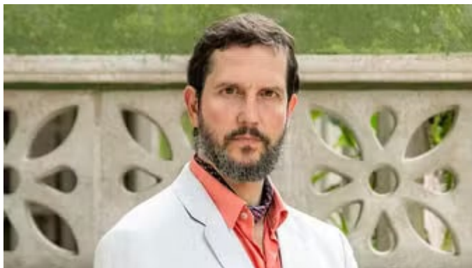
Egídio (Vladimir Brichta) em 'Renascença'

Entretê | Vladimir Brichta, que interpreta o Coronel Egídio no remake de Renascença na Globo, tem lidado com as críticas à novela com uma atitude serena e positiva.