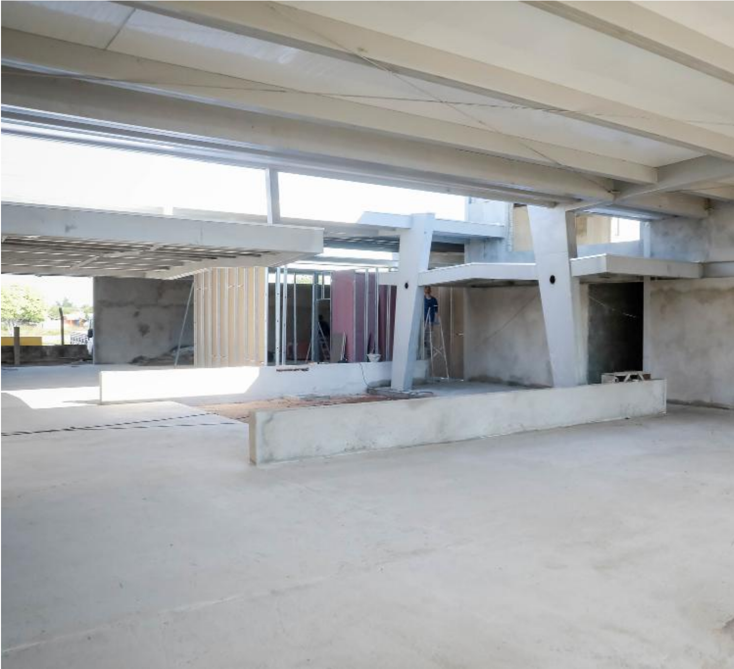
Essa é a primeira grande reforma realizada no local

noturno. O Aeroporto Nelson Dantas foi inaugurado em 1997 e esta é a primeira grande reforma executada no local.