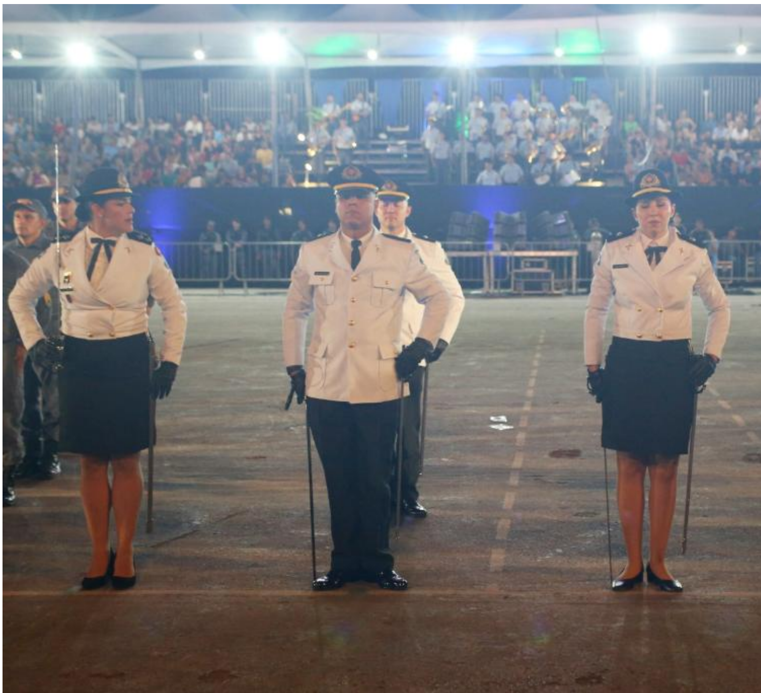
Novos oficiais médicos da Polícia Militar

Além disso, mais 295 policiais militares foram promovidos a novos postos dentro da corporação. Entre os cargos de oficiais, 30 policiais foram promovidos ao posto de capitão e oito militares foram graduados na função de tenentes-coroneis.