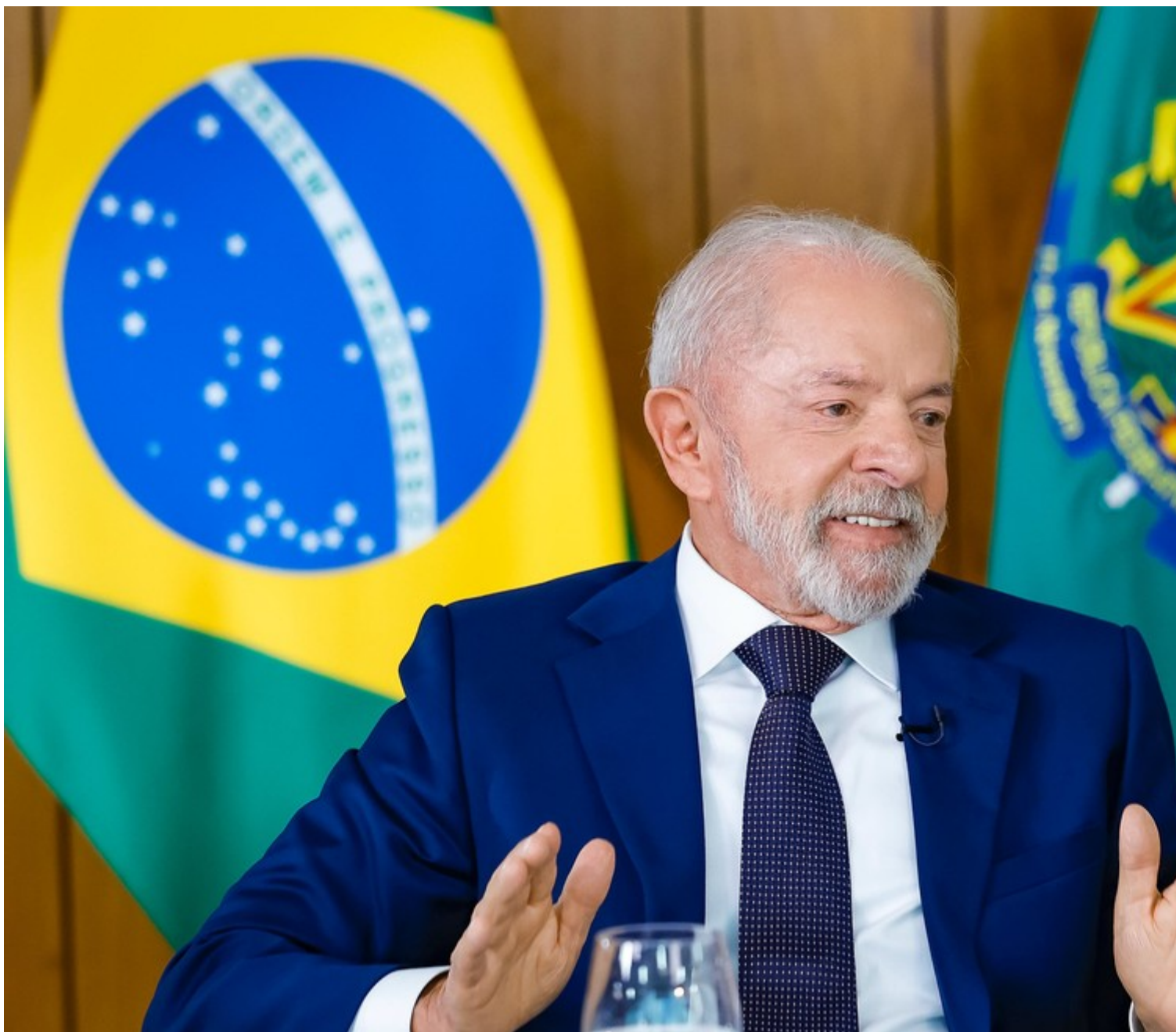
Presidente Lula durante entrevista