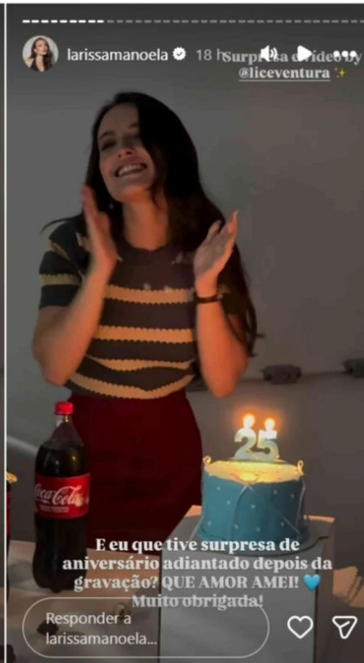
Larissa Manoela.