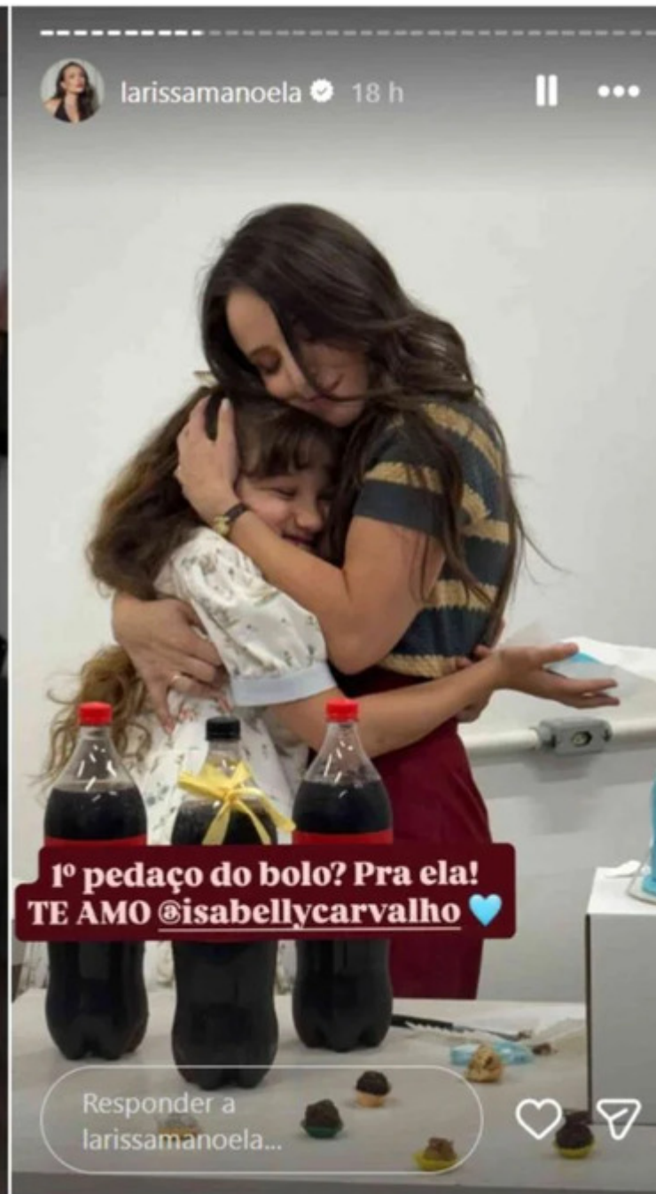
Larissa Manoela.