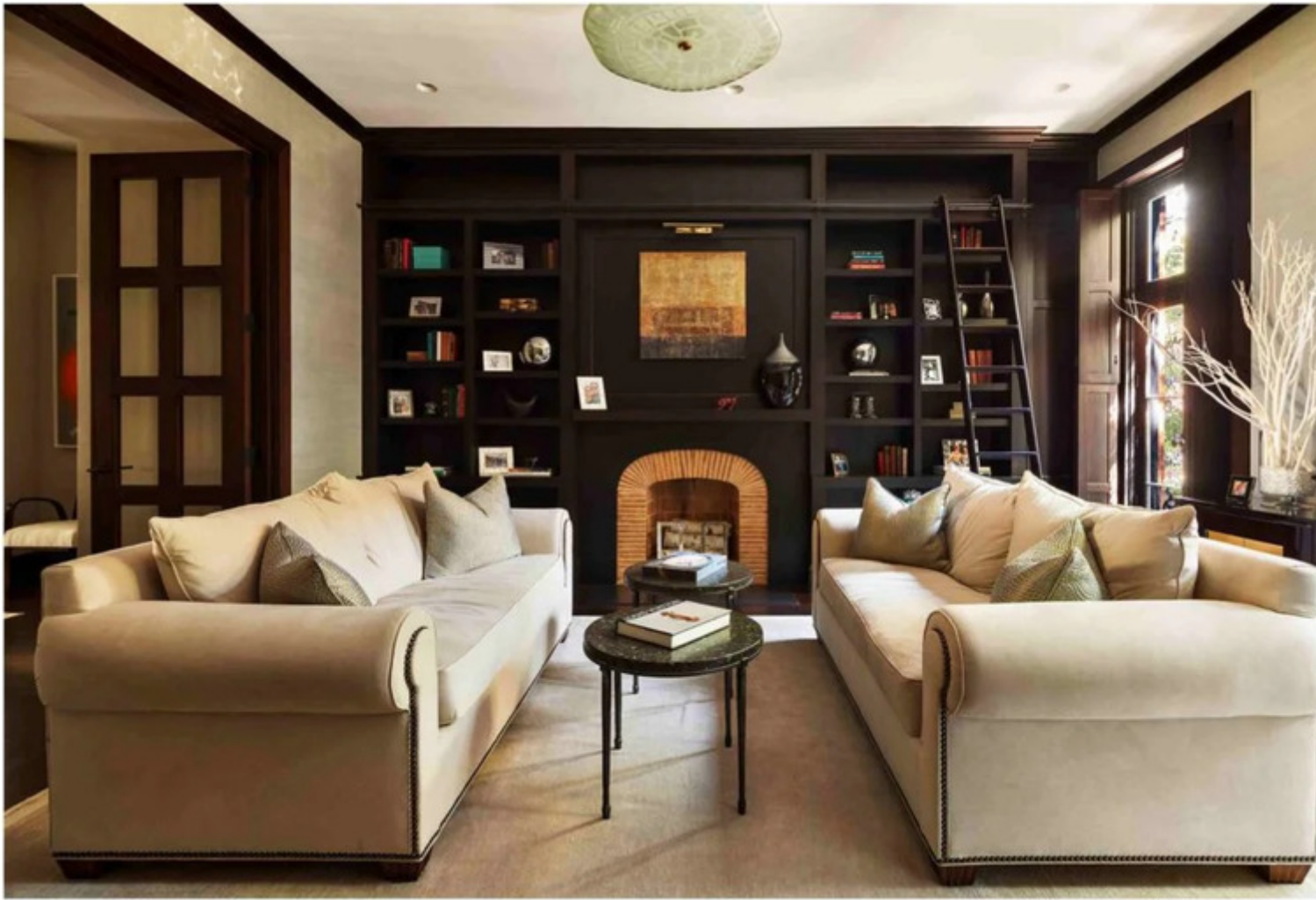
Sala de estar da casa de Gisele Bündchen. Imagem/Reprodução.