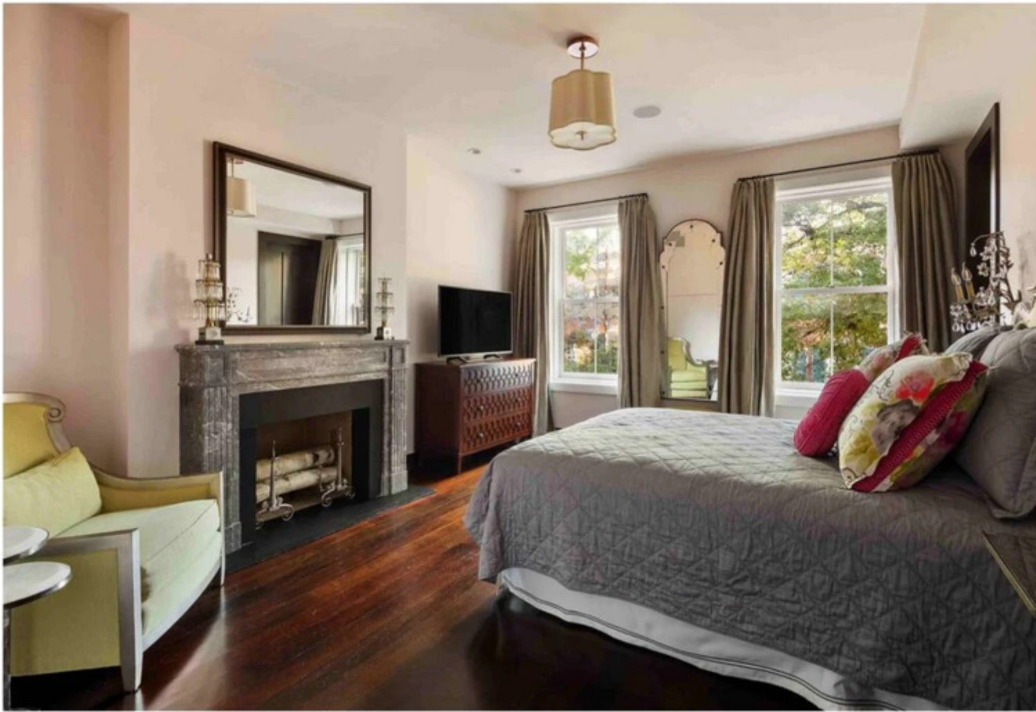
Suíte da casa de Gisele Bündchen. Imagem/Reprodução.