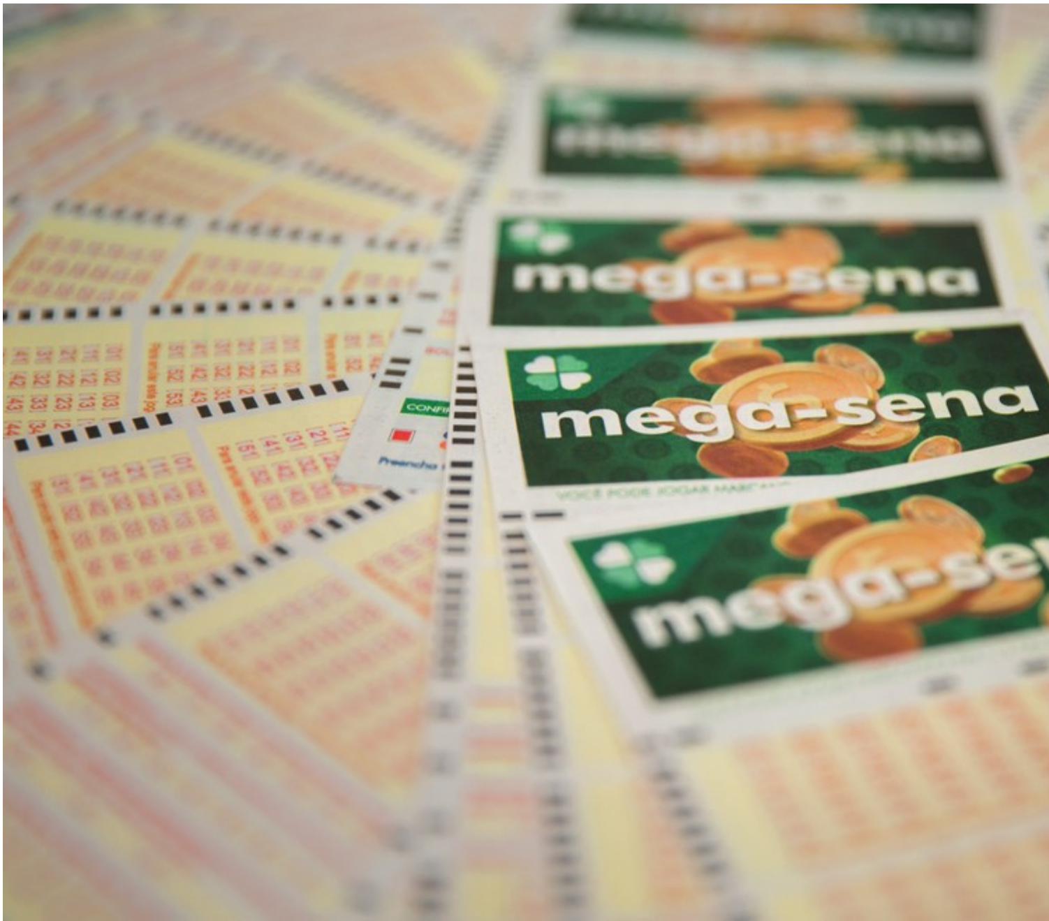
Bilhetes da Mega-Sena, em imagem de arquivo