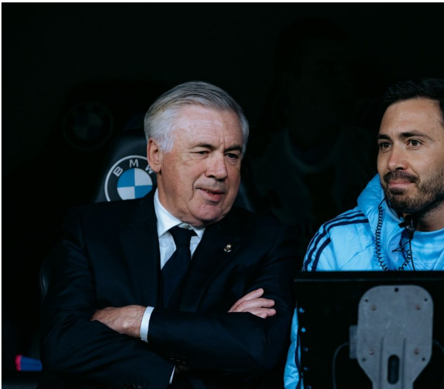
Carlo e Davide Ancelotti conversam em jogo do Real no Bernabéu

Auxiliar mais próximo do pai, Davide tem presença confirmada na Data Fifa de junho para as partidas contra Equador e Paraguai, mas futuro ainda em avaliação. O italiano de 35 anos quer seguir carreira solo como treinador e tem propostas na mesa, entre elas do Rangers, da Escócia, e ainda avalia se adiará o projeto ou será figura itinerante somente em convocações.