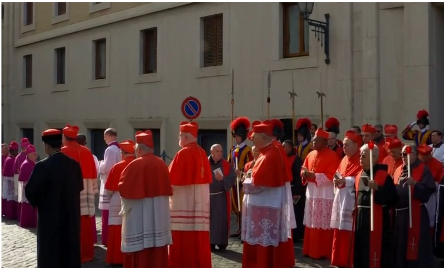
Começa procissão