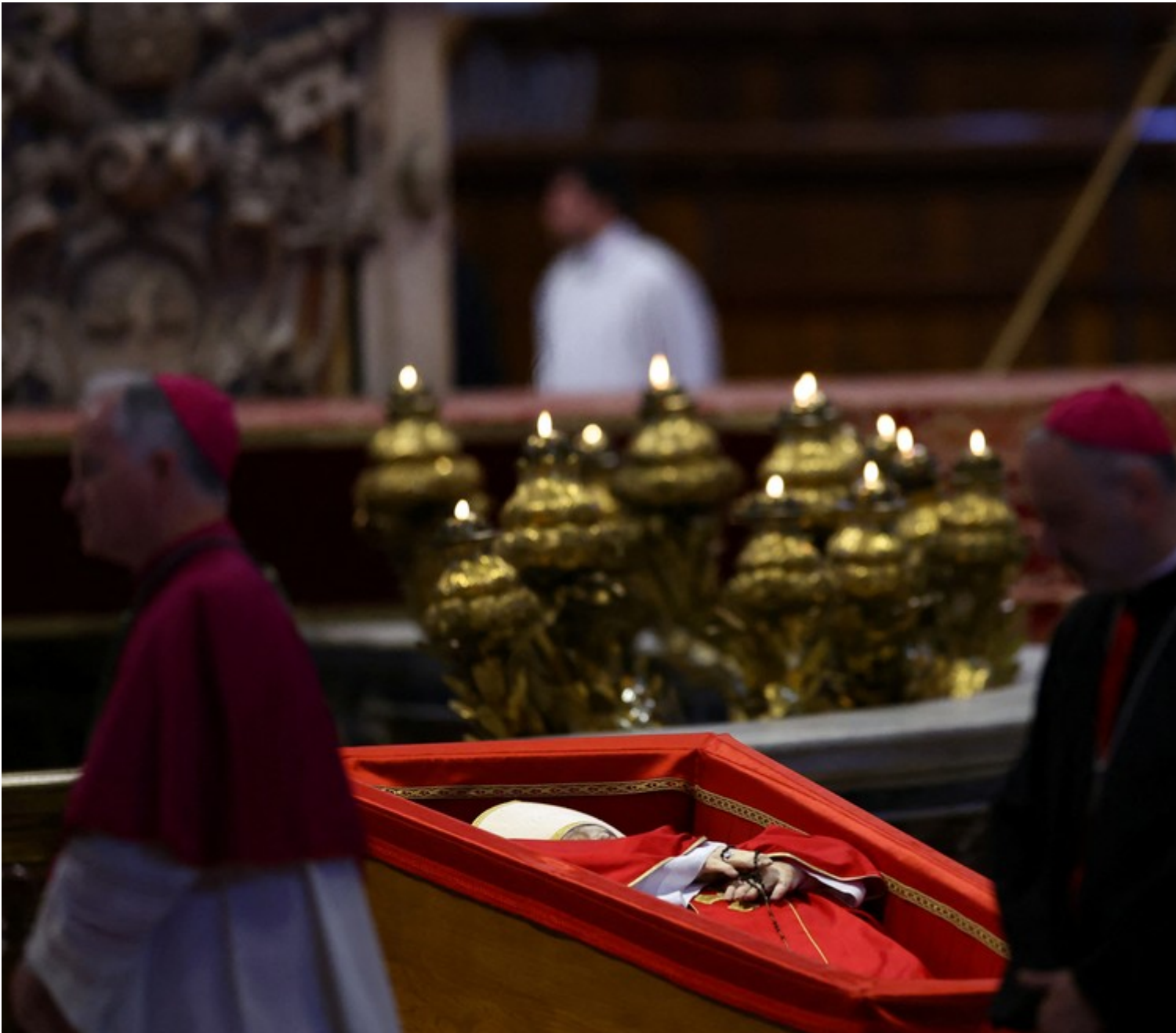
Corpo do papa Francisco é velado na Basílica de São Pedro em 23 de abril de 2025. | Foto: REUTERS/Hannah McKay