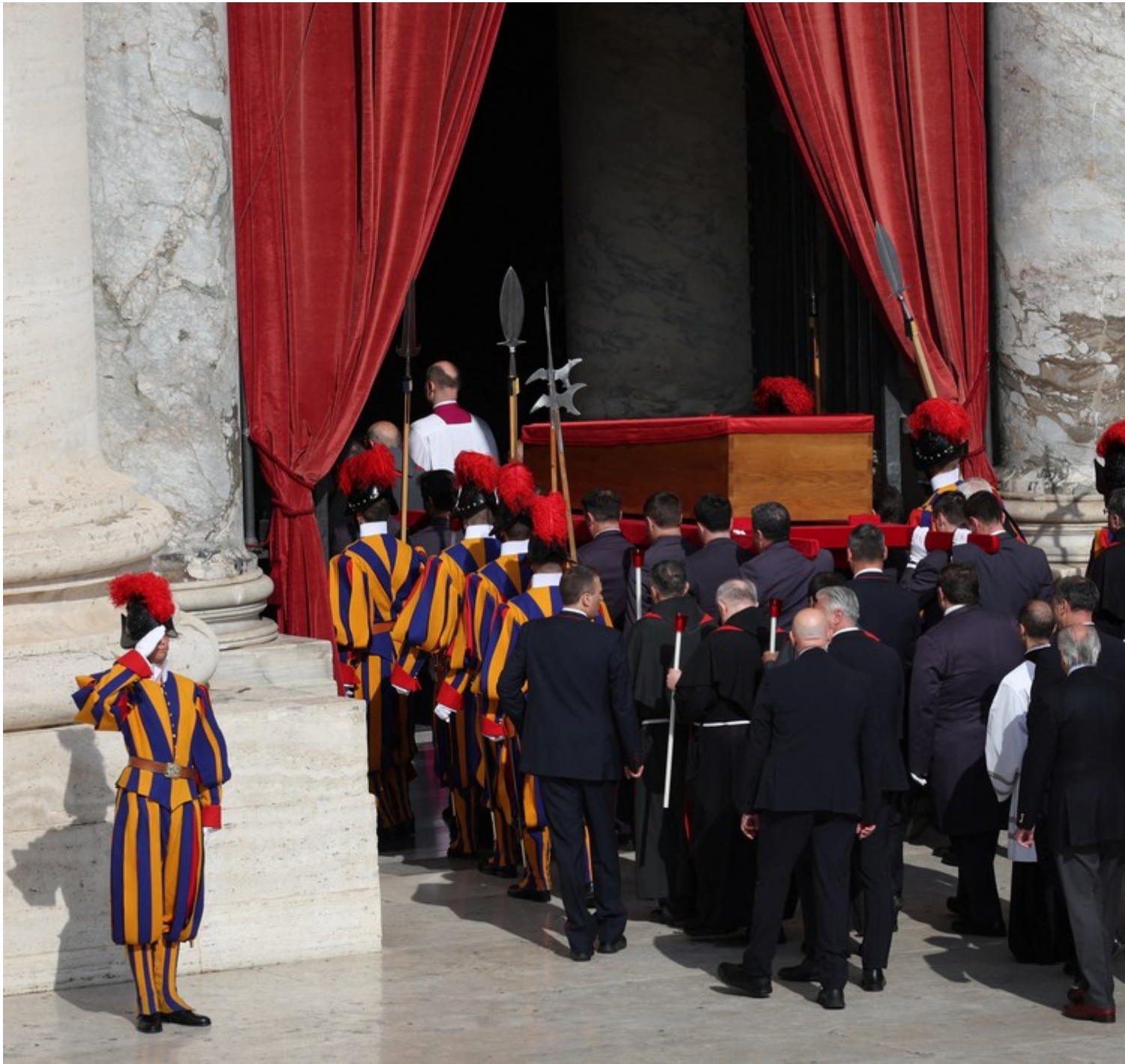
Corpo de papa Francisco chega à Basílica de São Pedro