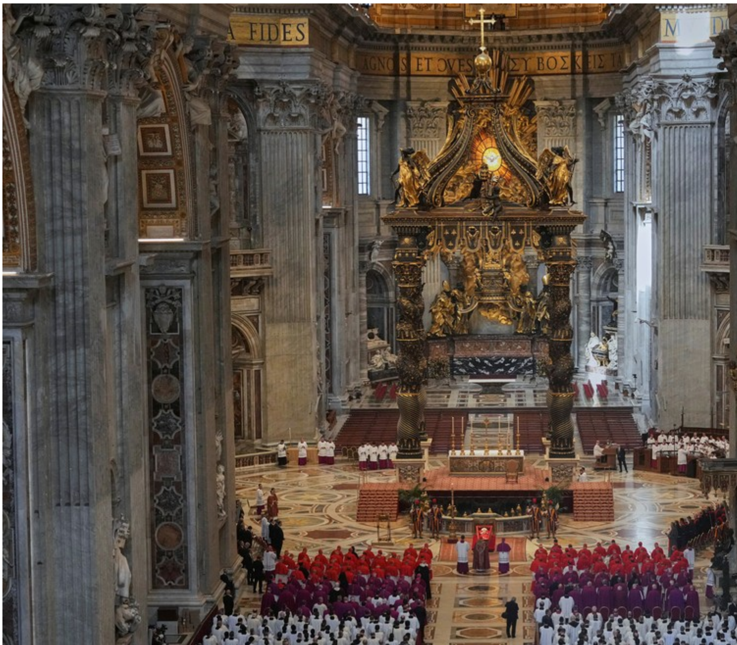
Corpo do papa Francisco sendo velado na Basílica de São Pedro em 23 de abril de 2025.

Anteriormente, a procissão também passava pelo Palácio Apostólico. No entanto, Francisco retirou o local do trajeto para deixar a cerimônia ainda mais simples.