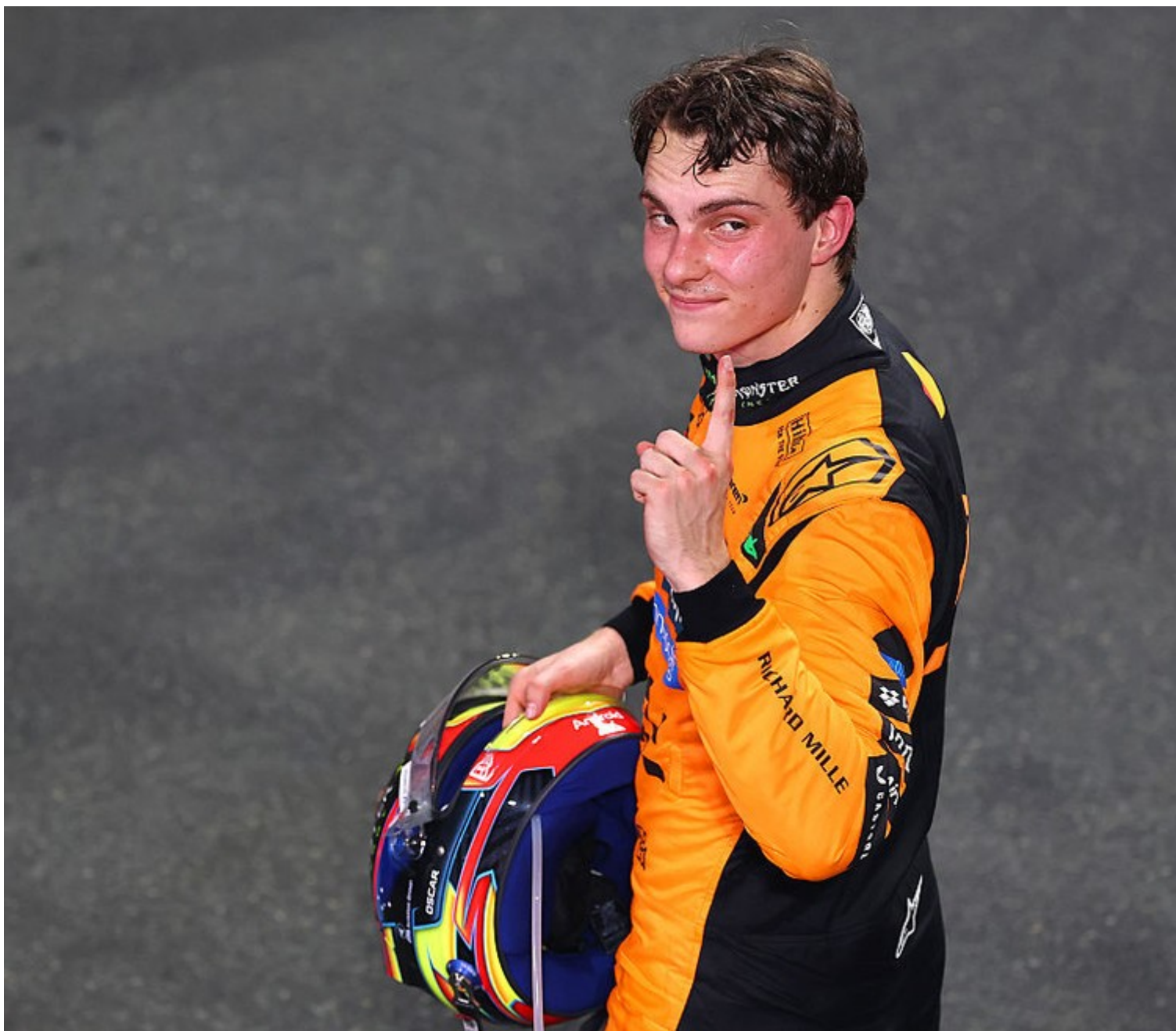
Líder da F1 2025, Oscar Piastri celebra vitória na Arábia Saudita

Piastri, que também já venceu nos GPs da China e Bahrein neste campeonato, desbancou o colega Lando Norris da posição. Ele agora sustenta 99 pontos na tabela, dez a mais que o colega de equipe, que cruzou a linha de chegada em quarto após largar do décimo lugar - graças a uma batida na classificação deste sábado.