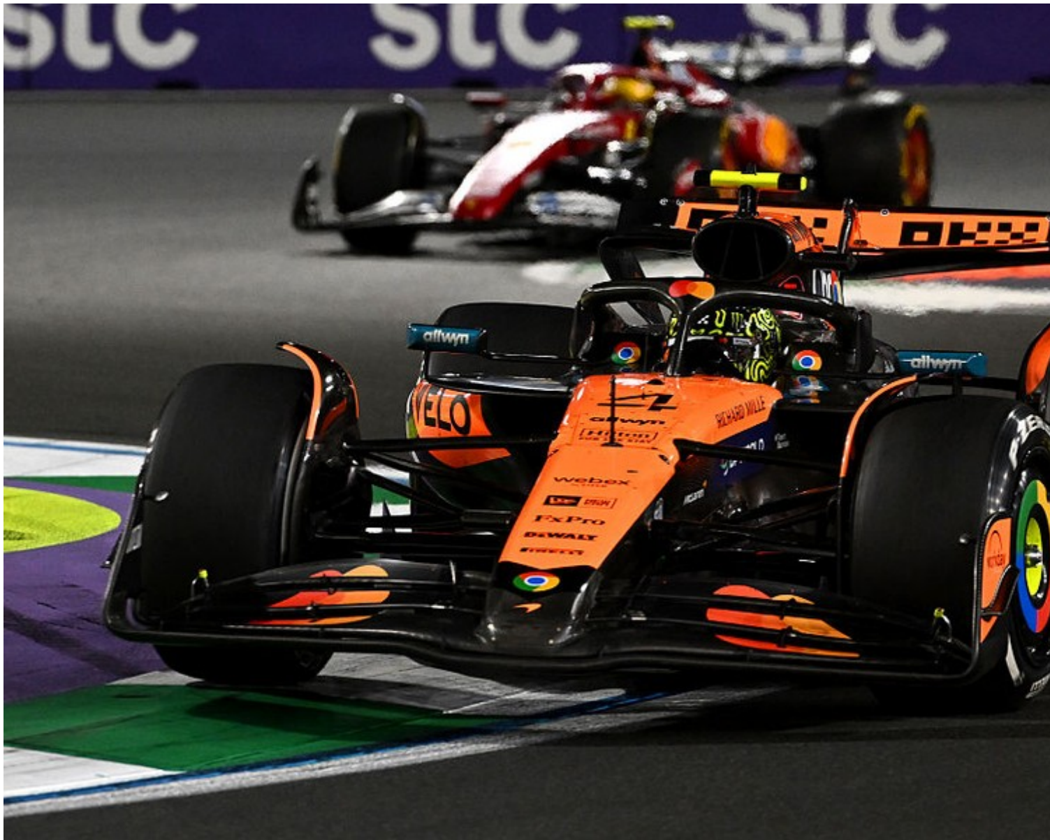
Lando Norris no GP da Arábia Saudita de F1 em 2025

Norris optou por começar a prova de pneus duros, do décimo lugar, postergando sua troca de pneus para tentar recuperar o prejuízo da batida no fim da classificação em Jeddah. Na largada, ganhou duas posições e, após o safety car, passou Carlos Sainz por mais uma. Ele entrou no top 5 da corrida na 19ª volta, deixando para trás Hamilton e Andrea Kimi Antonelli, da Mercedes.