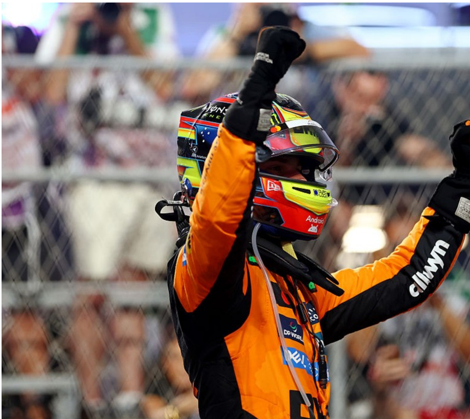
Oscar Piastri comemora vitória no GP da Arábia Saudita da F1 2025

Gabriel Bortoleto largou de pneus médios em 20º e aproveitou o safety car na primeira volta para aderir aos compostos duros, com os quais superou a marca de 40 voltas; ainda assim, avançou pouco, chegando a ser advertido por um toque com Fernando Alonso quando andava em 15º. O calouro da Sauber terminou a prova em 18º; Nico Hulkenberg, seu colega, ficou na 15ª posição.