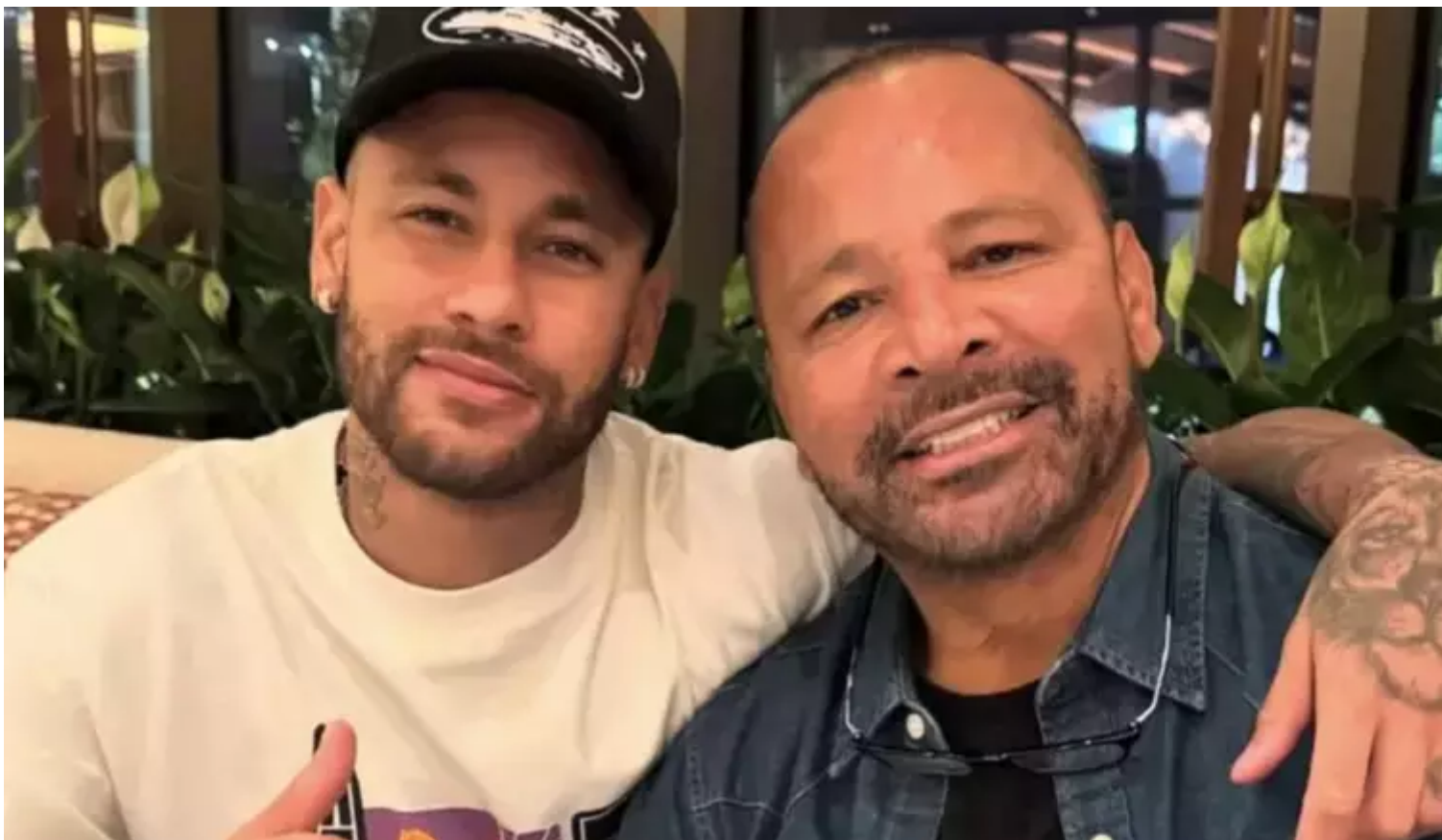
Neymar Pai nega ter comprado vídeo que comprova suposta traição do filho

"Pergunte para ela, só meu amigo, onde está o Pix? Fala para ela mostrar o vídeo. Pode vender, é para vocês comprarem o vídeo dela. Comprem o vídeo que ela tem porque eu não paguei nada para ela. Simples assim", disse Neymar Pai em áudio enviado ao jornalista Leo Dias durante o programa ao vivo Fofocalizando, do SBT.