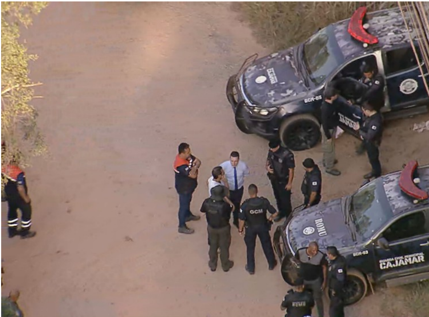
Polícia de SP encontra corpo em Cajamar que pode ser de adolescente desaparecida