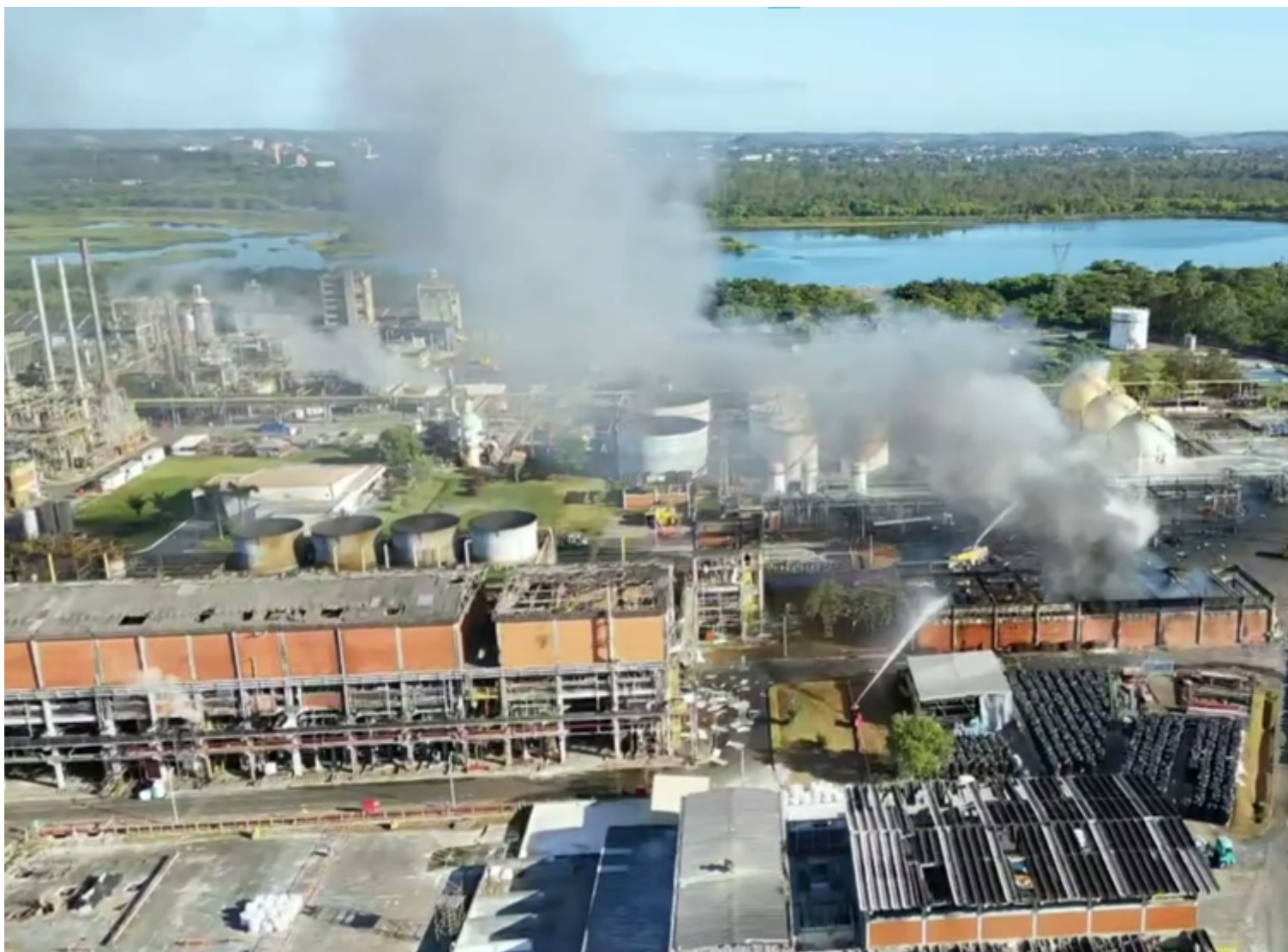
Explosão seguida de incêndio foi controlada pelo Corpo de Bombeiros

Apesar disso, moradores da região se assustaram com o barulho da explosão e com as chamas. Além disso, moradores dos bairros Mangueiral, Gravatá e Parque Satélite relataram um suposto tremor provocado pela explosão.