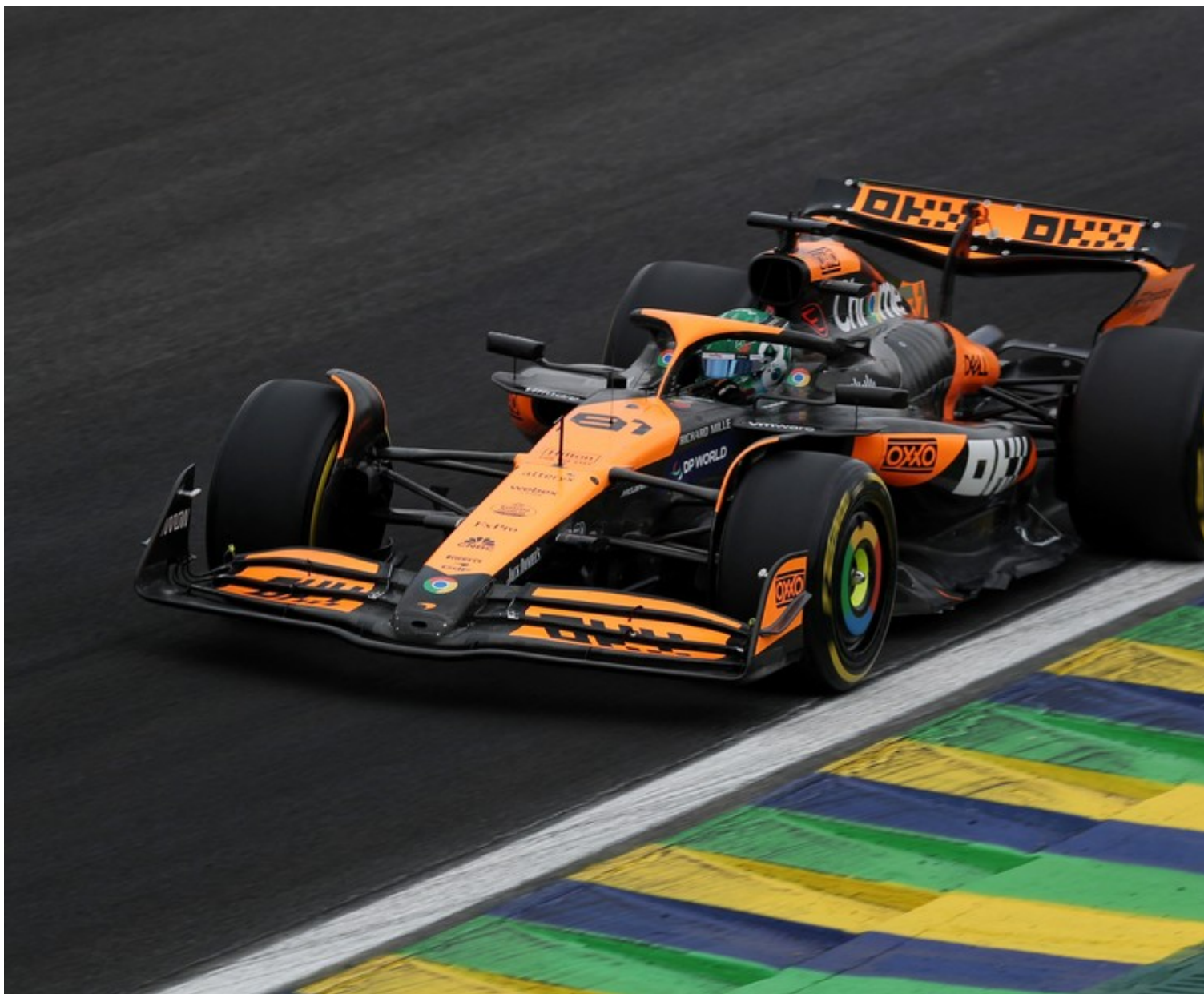
Oscar Piastri GP de São Paulo qualificação sprint

Charles Leclerc, da Ferrari, fechou o top 3 com o tempo de 1m09s153. Max Verstappen, líder do campeonato com a RBR, terminou em quarto lugar. O destaque negativo ficou com Lewis Hamilton: o piloto da Mercedes não foi bem no SQ2 e amargou a eliminação. O britânico largará na 11ª colocação.