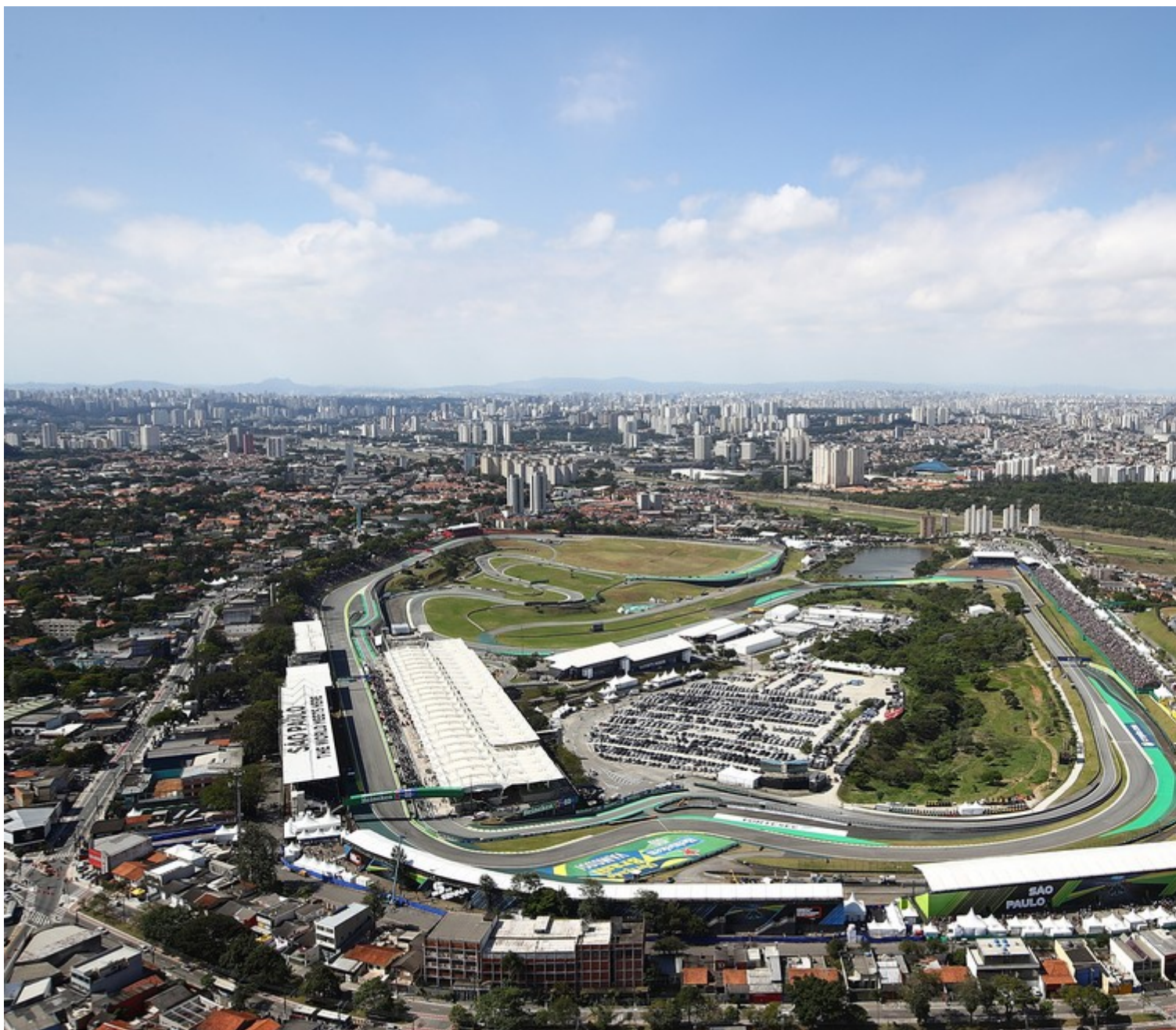
Vista aérea de Interlagos, palco do GP de São Paulo de F1, na temporada 2021

A corrida curta está programada para acontecer no sábado (2), mas antes disso os carros vão à pista para o primeiro e único treino livre do final de semana na sexta (1) a partir das 11h30 (horário de Brasília). Depois, os pilotos vão acelerar à tarde durante a classificação sprint para definir o grid para a prova de 100km do dia seguinte.